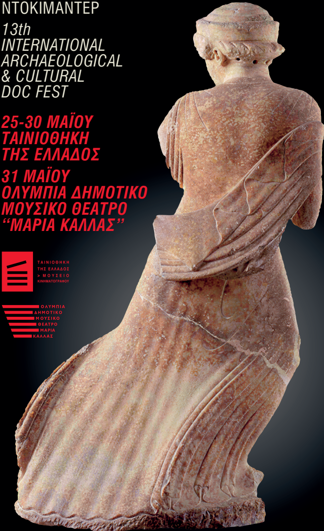
Αρχαιολογικό Μουσείο Ελευσίνας | Archaeological Museum of Elefsina